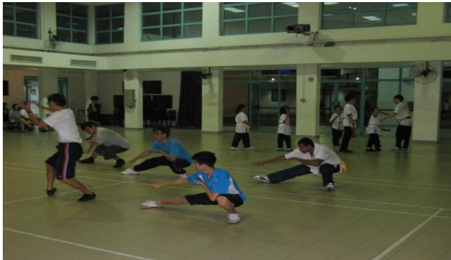
德义洪拳武术队訓練