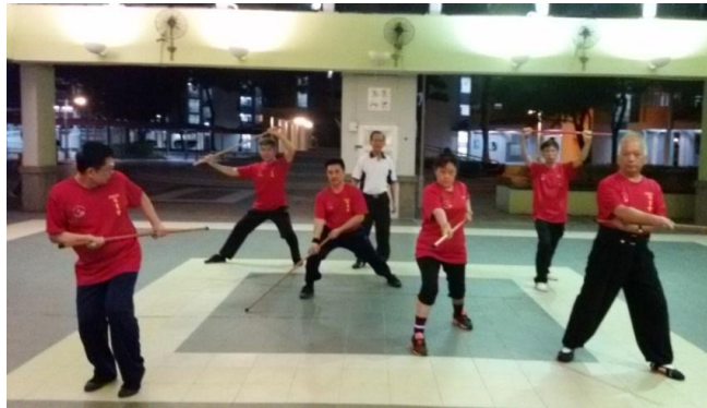
德义洪拳武术队訓練