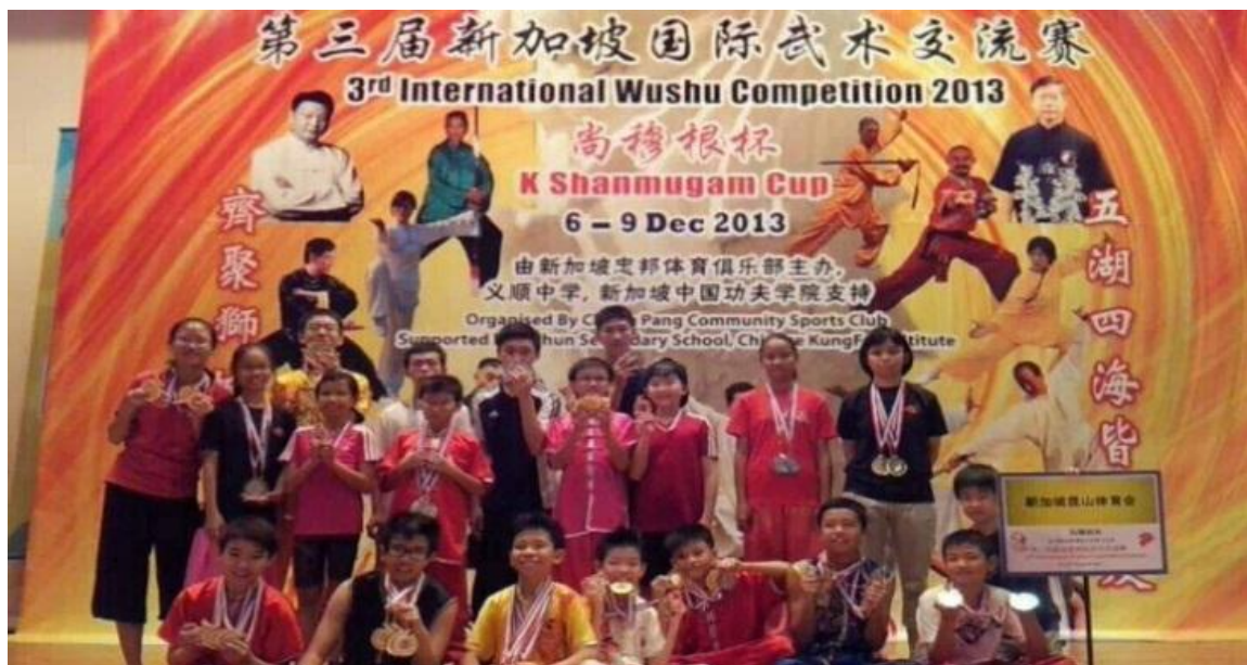
2013“尚穆根杯”外家拳团体总冠军