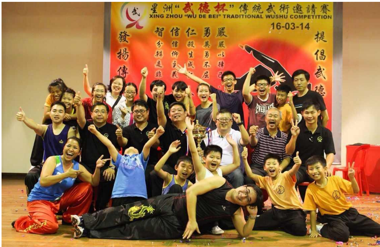
“武德杯”2014 团体总冠军！