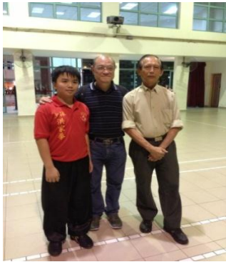
香港洪拳李烂窩師傅到访